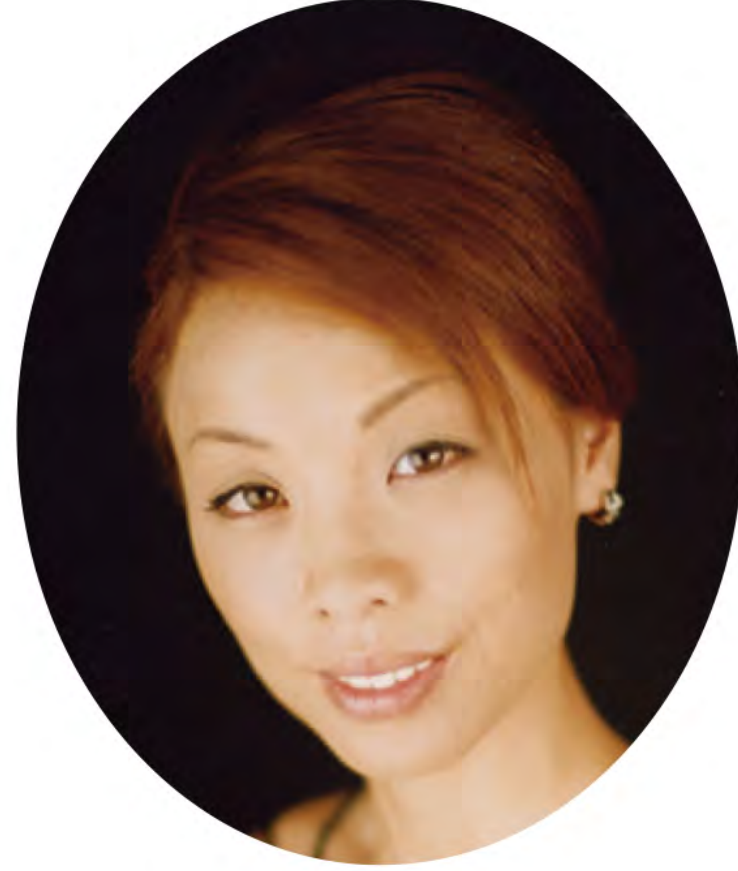
川畑麻弓 ミストレス