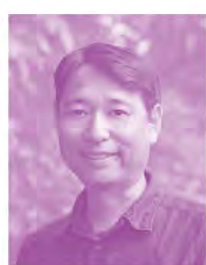
観客を魅了する 優美な舞を 心とカメラに 写し込みます。 テス・大阪 古都 栄二